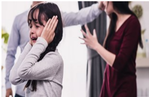
Programa de Prevención Contra la Violencia Doméstica

La violencia domestica lastima a toda la familia . Nunca resuelve conflictos, solo crea mas problemas entre familias.